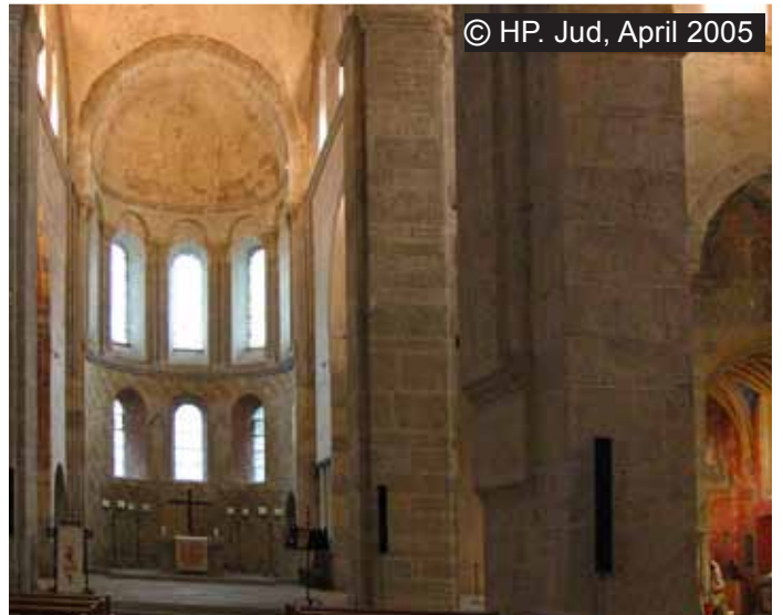
Die romanische Abteikirche Payerne im cluniazensischen Baustil (Modell-Foto).