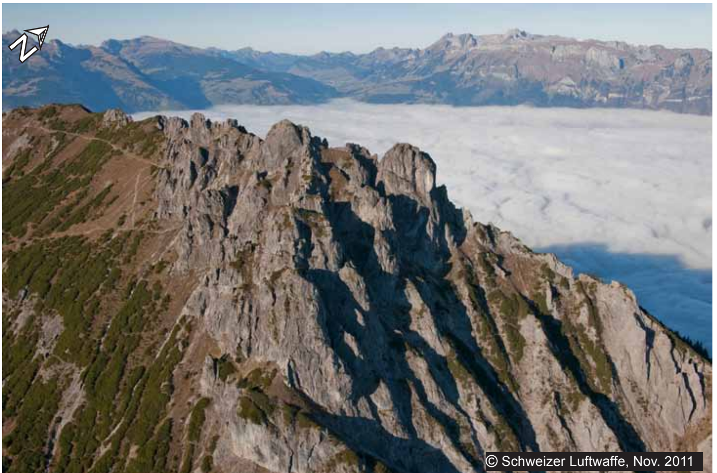
Die «Drei Schwestern» mit Blick Richtung Westen (Toggenburg, Alpstein, Rheintal)