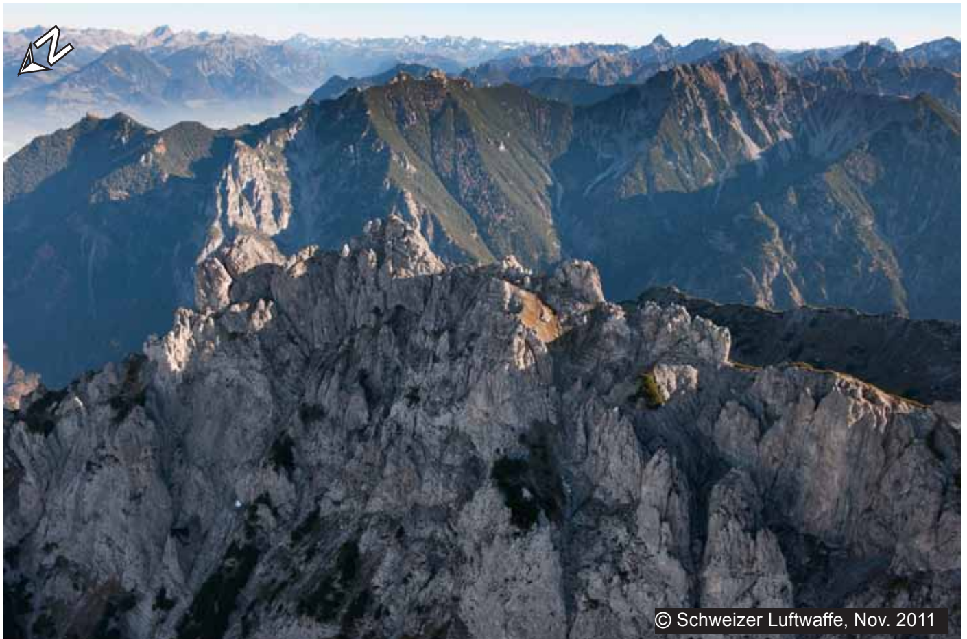
Die «Drei Schwestern» (Vordergrund) mit Blick Richtung Osten (Österreich)