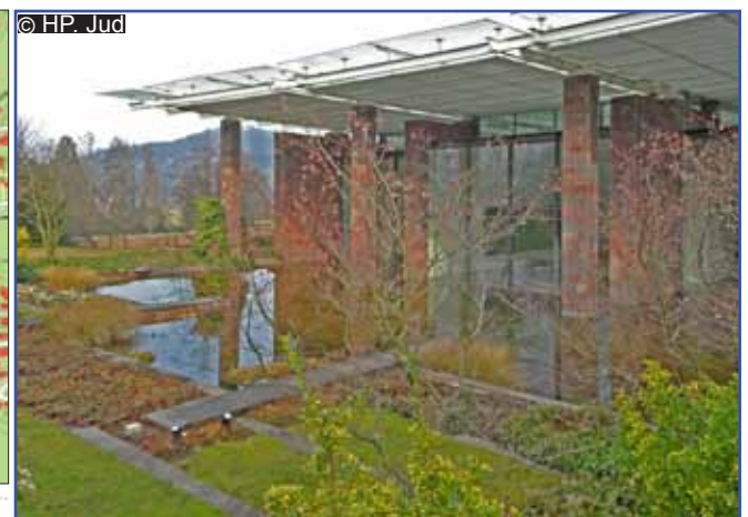
© HP. Jüd Wintergarten mit Biotop des 1997 eröffneten Kunstmuseums