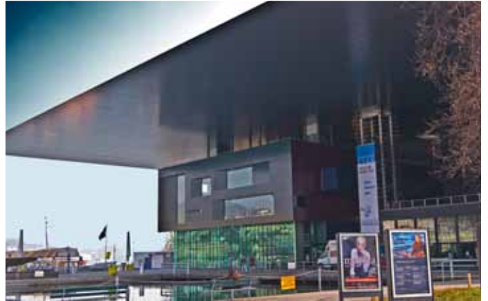
Oben: Blick von den Museggtürmen aufs Seebecken mit KKL, Detailaufnahmen des von Jean Nouvel erbauten Kultur- und Kongresszentrums.