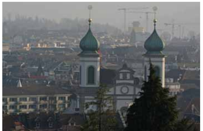
© Bilder: Hanspeter Jud, Februar 2011