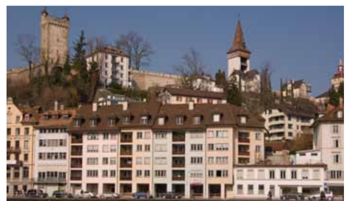
Die Museggmuer und -türme