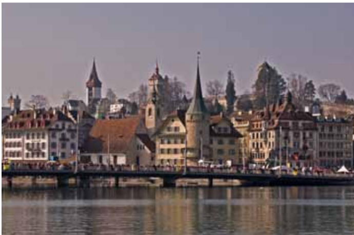
Unten: Blick auf die Seebrücke zu den Museggtürmen, Blick ins Seebecken, Hofkirche (links) und Jesuitenkirche (rechts).